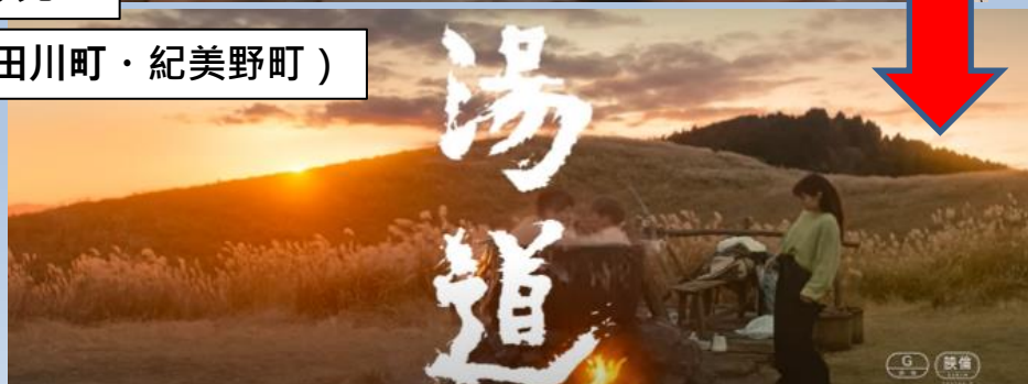
生石高原（有田川町・紀美野町）