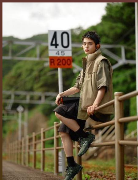
JR見老津駅 (すさみ町)