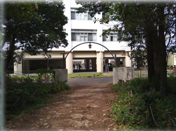
国立病院機構和歌山病院(美浜町)