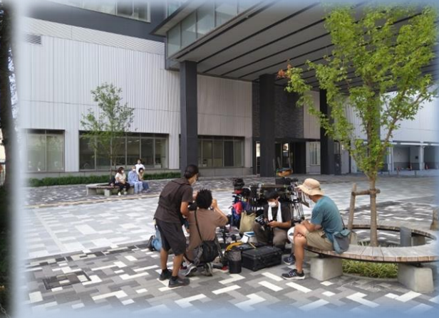
和歌山県立医大薬学部(和歌山市)