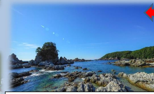
朝貴神社周辺の海岸 (串本町)