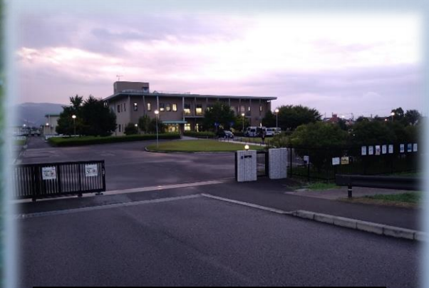
那賀浄化センター(岩出市)