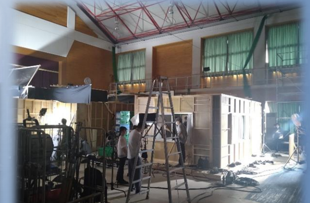
和歌山医療スポーツ専門学校(有田市)