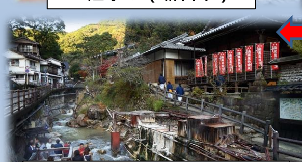
湯の峰温泉 (田辺市本宮町)