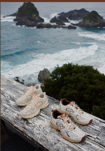
婦夫波・BUSH DE COFFEE (すさみ町)