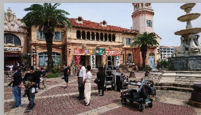
〔カムカムエヴリバディ〕