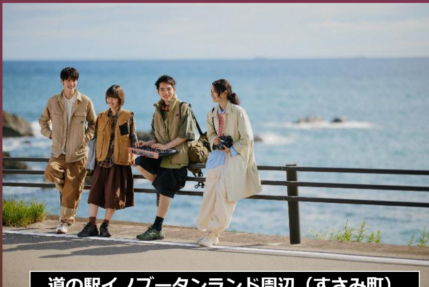
道の駅イノブータンランド周辺 (すさみ町)