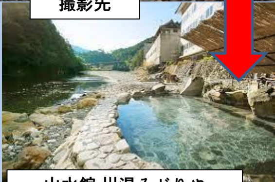
山水館 川湯みどりや 住所：田辺市本宮町川湯13