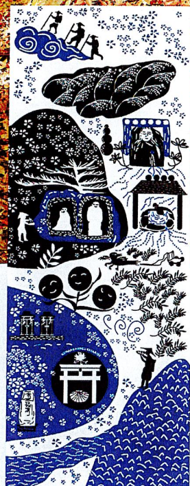
世界遺産登録20周年記念 大日山周遊寺ぬぐい

熊野本宮語り部の会では、大日山周遊ルートウォークを毎月第3土曜に開催します。全参加者に世界遺産登録20周年を記念して作成した大日山周遊ルートオリジナルの寺ぬぐいをプレゼントいたします。