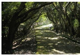
カンドリーロード